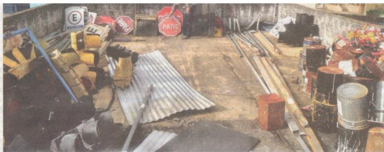
Materiais inservíveis estão no Departamento de trânsito