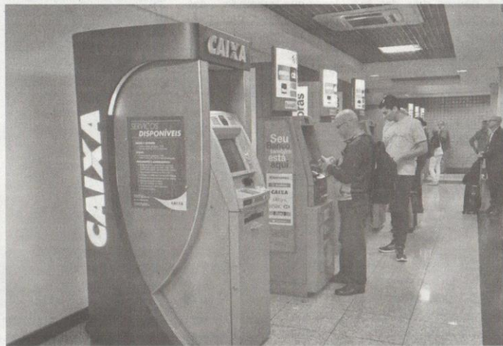
CÂMARA analisa PL que exige vigilantes enquanto os caixas instalados em bancos estiverem em funcionamento

De forma voluntária, um dos integrantes do Círculo de Pais e Mestres (CPM), profissional da área de energia elétrica, fez todo o levantamento e um estudo, que aponta a carga atual de 47kWh. Com a previsão dos novos aparelhos de ar-condicionado, e deixando ainda uma reserva técnica, chegaria a 63 kWh.