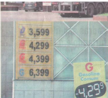
NA TARDE de ontem, 4, o preço da gasolina variava em R$ 0,12 em dois postos próximos, na Rua Buarque de Macedo, no centro de Montenegro