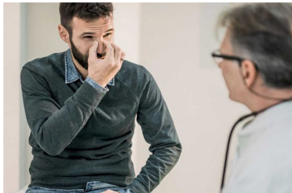
Doença tem tratamento

Recentemente foi publicado edital para a compra na modalidade de Concorrência Internacional. A abertura das propostas será feita no mesmo dia do fim da licitação. Maiores informações podem ser consultadas no site das compras eletrônicas do governo estadual.