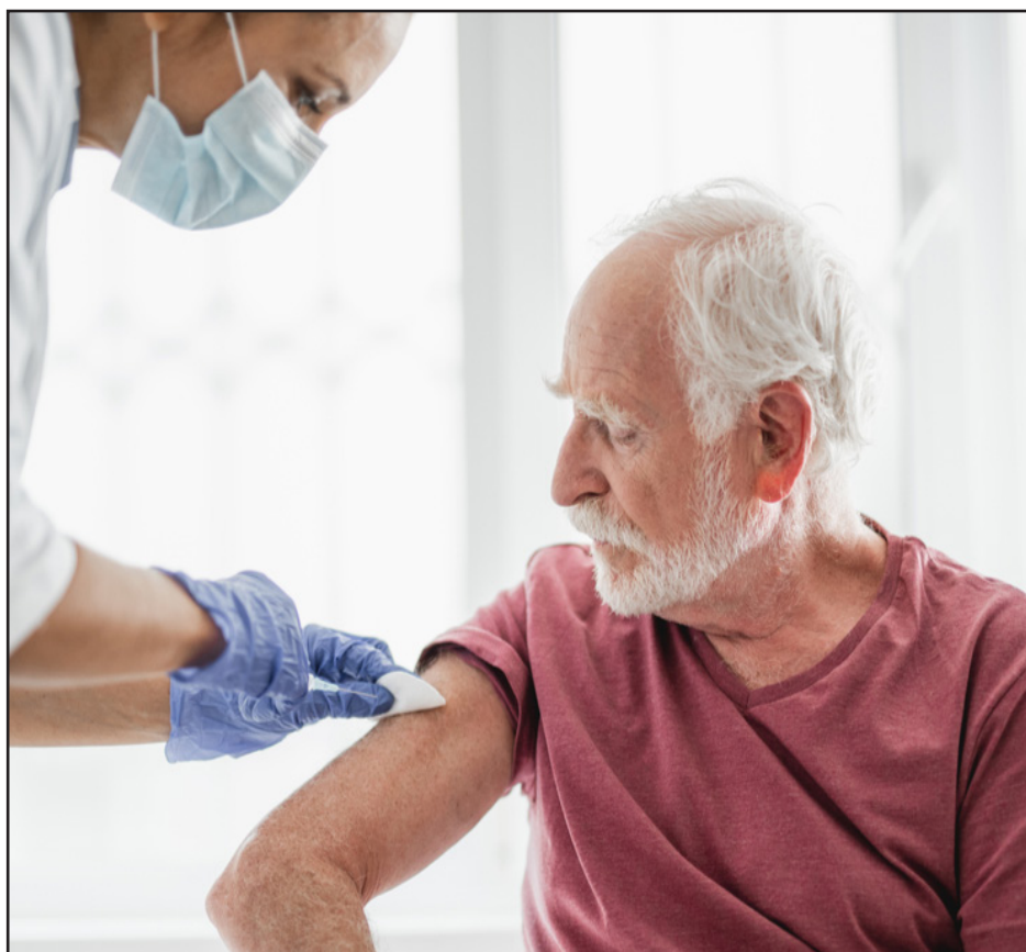
Vacina contra Covid-19

(51) 36339112 das 8h às 11h30 e das 13h às 16h30. No dia da vacinação é obrigatório apresentar a caderneta de vacinação.