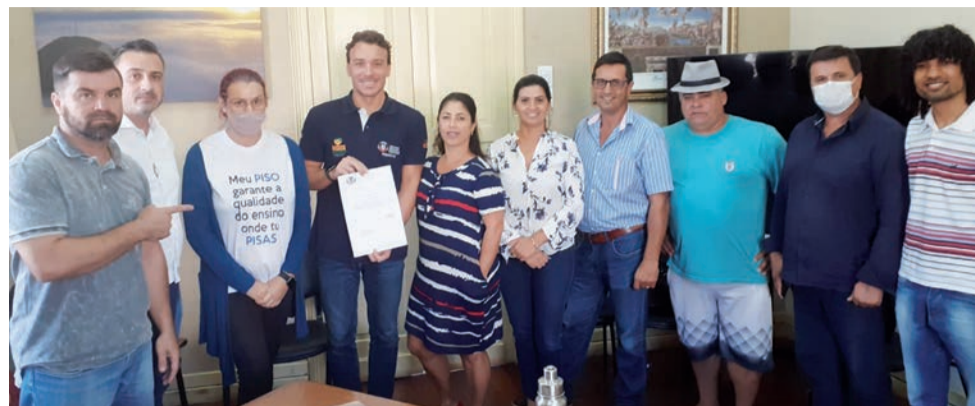
Prefeito chamou representantes do sindicato para comunicar a decisão nesta quinta

O acordo feito na manhã desta quinta-feira determinou a formação de um grupo de