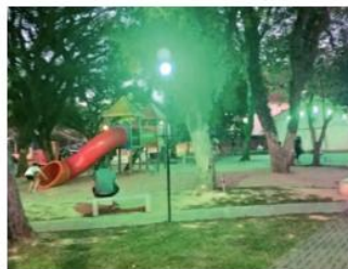
Em clima de copa, Praça da Timbaúva ganha iluminação especial

Além disso, nesta quarta-feira, 30, ocorre a comemoração dos 9 anos do Telecentro, às 14h45, com apresentação da Banda Marcial da Escola Municipal do bairro São Paulo e do Grupo Criarte, da Fundação Municipal das Artes (Fundarte). (RK)