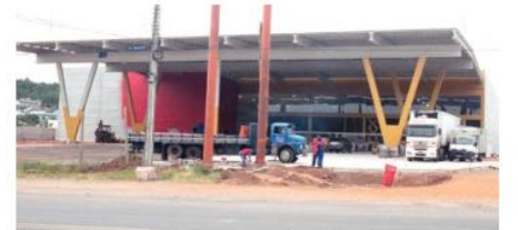
Novo supermercado funcionará no bairro Panorama

No caso de não cumprimento da contrapartida ou de encerramento das atividades da empresa em 10 dez anos, o Município será indenizado no valor dos benefícios concedidos. O novo supermercado será no bairro Panorama, às margens da RSC-287, onde funcionou a empresa Zaraplast, com inauguração prevista para dezembro. (RE)